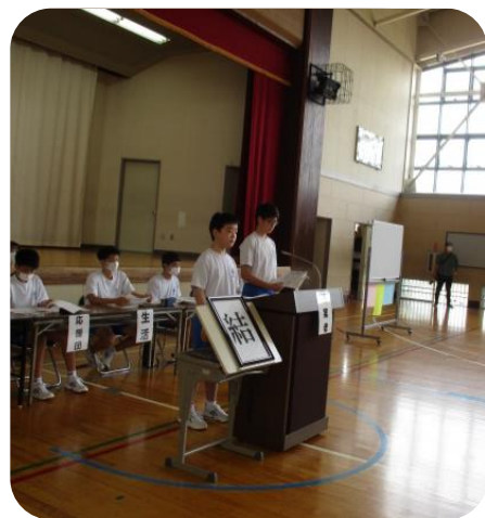
生徒会長からの提案

校長先生からは「生徒総会を書面や放送での会議でなく、全校生が一堂に会して開催できたことが嬉しい。」「生徒総会はまとめの会ではなく、スタートの会である。」「スローガン「結」は“ゆい”とも読む。沖縄の「ゆいまーる」という言葉を知っていますか。高中生徒会が目指していることとも関連があること」といったお話を頂きました。「ゆいまーる」どんな言葉なのか改めて調べてみましょう。