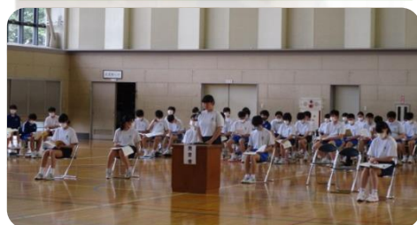
各クラスからの意見発表